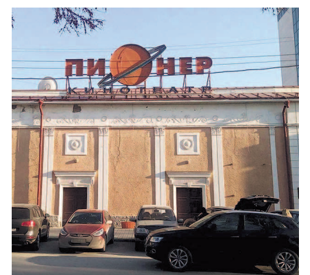
НА ФОТО: КИНОТЕАТР СТАНЕТ ТЕАТРОМ