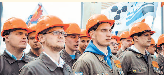
НА ФОТО: СТУДЕНТЫ ПОМОГУТ СТРОИТЬ ГОРОД