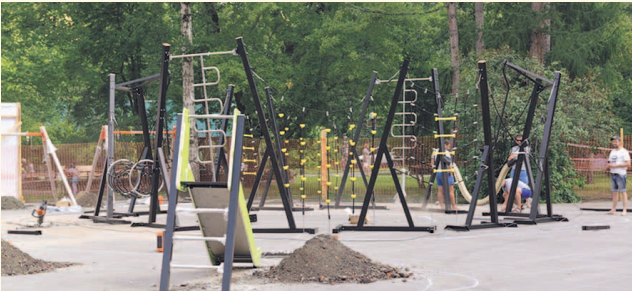
НА ФОТО: НОВАЯ СПОРТПЛОЩАДКА В ЦЕНТРАЛЬНОМ ПАРКЕ