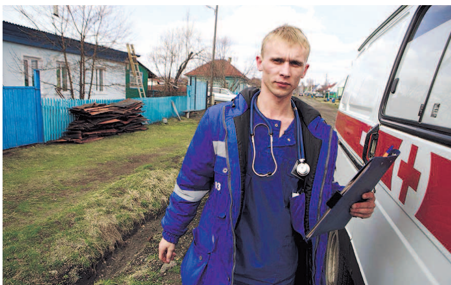
НА ФОТО: МОЛОДЫЕ СПЕЦИАЛИСТЫ ПОТЕРЯЮТ ВЫПЛАТЫ ПРИ РАБОТЕ НА ЧАСТИ ТЕРРИТОРИЙ

— Оптимизация здравоохранения довела страну до того, что сейчас ни-