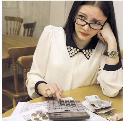
НА ФОТО: «ЗОЛОТАЯ» КОММУНАЛКА

— Исключение НДС из коммунальных тарифов позволит не поднимать