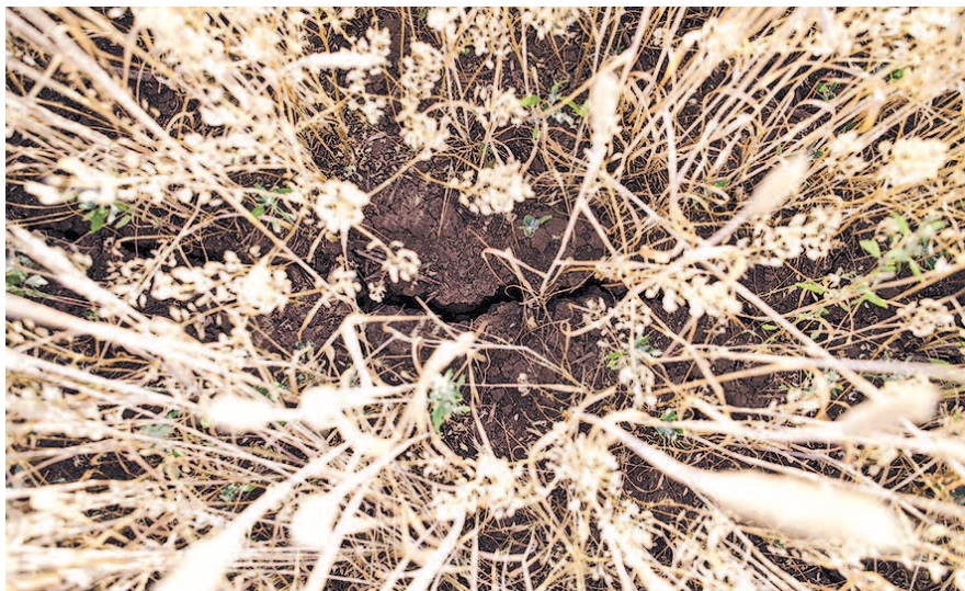
НА ФОТО: УРОЖАЙ ПОГИБНЕТ ПОЛНОСТЬЮ ИЛИ УДАТСЯ ЧТО-ТО СОБРАТЬ?

— Большая часть посевов пострадала, роста уже не будет. Это сто-