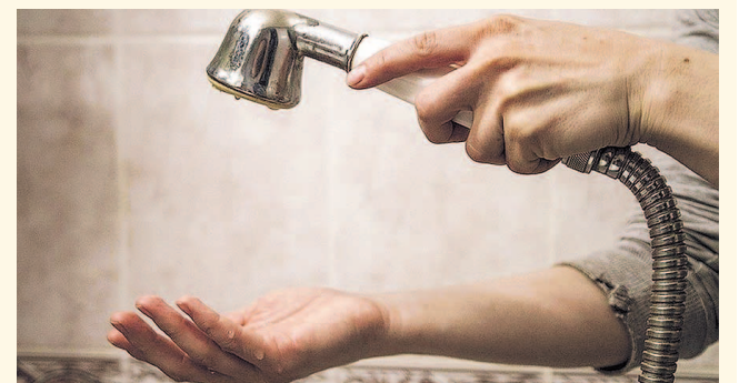
НА ФОТО: ЛЕТОМ ВОДЫ НА ВСЕХ НЕ ХВАТАЕТ