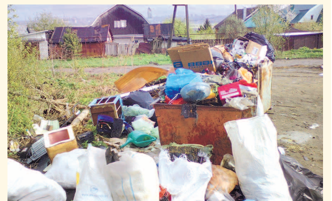
НА ФОТО: МУСОР НЕ ВЫВОЗЯТ УЖЕ ДВЕ НЕДЕЛИ