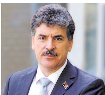
НА ФОТО: ПАВЕЛ ГРУДИНИН

— К январю 2018 года, когда произошло мое выдвижение на пост Президента РФ, уже было готово несколько судебных исков в адрес совхоза имени