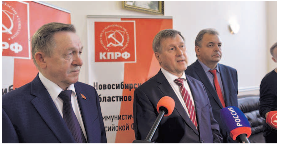
НА ФОТО: ВО ВРЕМЯ ПРЕСС-ПОДХОДА ПОСЛЕ КОНФЕРЕНЦИИ

— Это программа действий в непростых условиях развивающегося кризиса, в которую добавлены моменты, связанное с Новосибирском, — подчеркнул Анатолий Локоть. — В частности, я предлагал пересмотреть подходы к организации медицинского обслуживания в регионе. Неправиль-