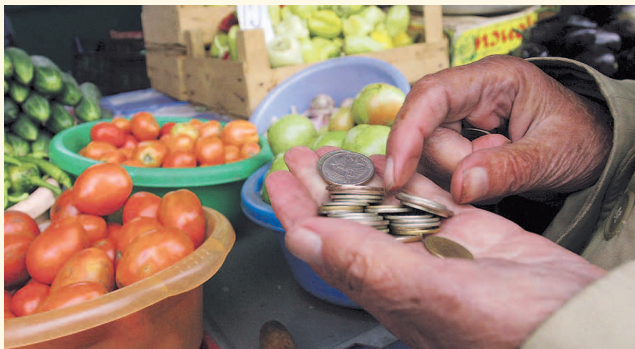
НА ФОТО: ПРОСТЫЕ ПРОДУКТЫ ПО ЦЕНЕ ДЕЛИКАТЕСОВ