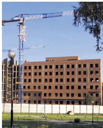
НА ФОТО: СТРОИТЕЛЬСТВО ПОЛИКЛИНИКИ

Кроме поликлиник, в Октябрьском районе появится новая долгожданная школа. Компания «Брусника. Сиб-